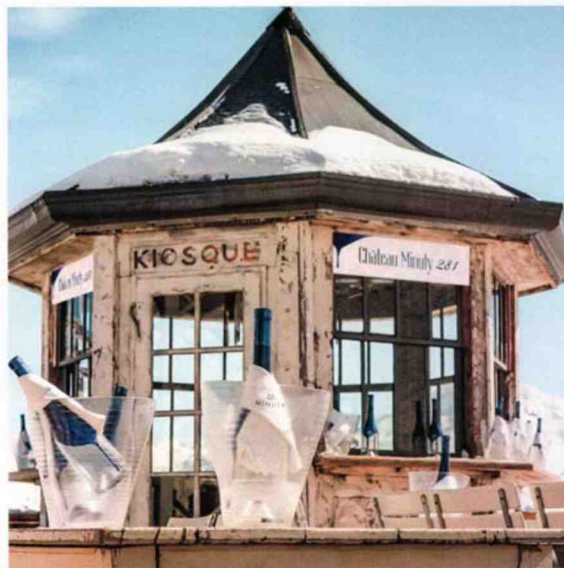
Château Minuty au Kiosque de La Folie Douce

Ouvert depuis 5 décembre 2018 jusqu'au 5 mai 2019. Télécabine de La Daille, 73150 Val d'Isère . Tél. : 04 79 06 07 17. lafoliedouce.com .